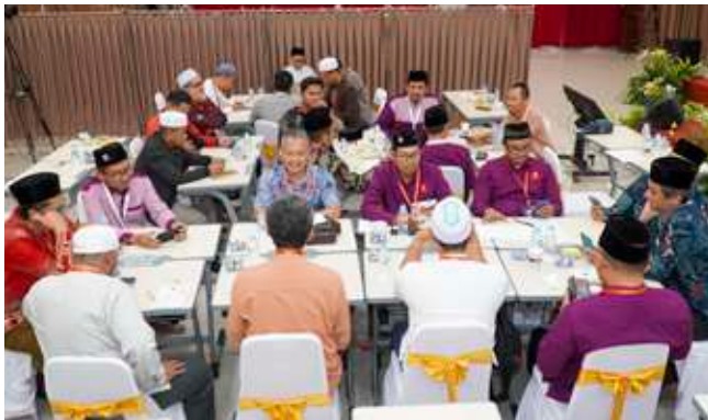
Peserta PPKYC secara berkelompok menyelesaikan tugas dari pemateri.