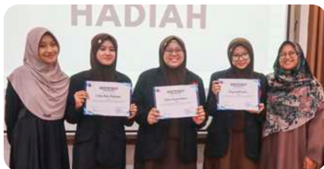
Presentator terbaik akhwat.