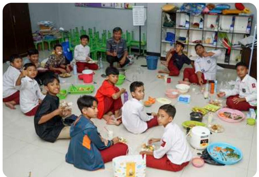
Siswa dan guru bersama-sama berbuka puasa, menikmati hidangan hasil karya siswa.

Di dalam rangkaian kegiatan To Be Chef , siswa ternyata tak hanya berlatih keterampilan memasak, tapi sekaligus menjalankan puasa sunah Kamis. Ini adalah biah shalihah , kebiasaan baik sebagai bagian dari pembentukan kepribadian Islam. Tak hanya itu, sembari menunggu terdengarnya adzan Maghrib, siswa dan guru juga mengkhawatirkan Al-Qur'an bersama-sama. Penguasaan tsaqafah Islam pun didapatkan, kedekatan anak dengan Al-Qur'an pun terjaga. Sungguh, To Be Chef adalah sebuah rangkaian kegiatan spesial di SDIT Insantama yang terintegrasi, mengimplementasikan sekaligus tiga misi SIT Insantama dan selalu dinantikan. Masyaallah.[]