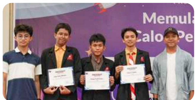
Presentator terbaik ikhwan.