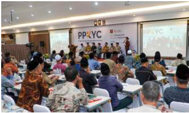
Pembukaan PPKYC (3/7/2025), tampak hadir seluruh jajaran pimpinan yayasan Insantama Cendekia.