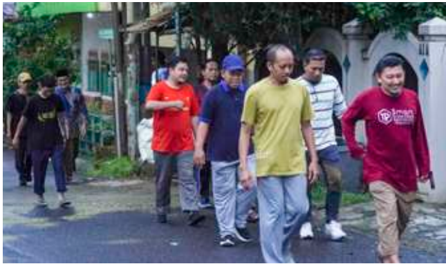
Jalan sehat pagi. Peserta bersama panitia mengisi pagi dengan jalan sehat bersama.