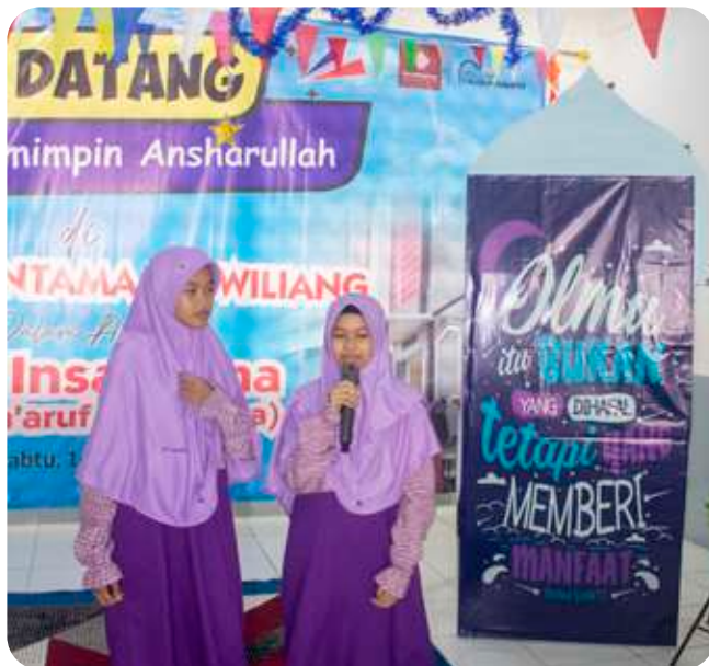
Kegiatan Satu Insantama, SMPIT Insantama Leuwiliang.

SaTu Insantama Serentak di Leuwiliang, Cilegon, dan Ternate.