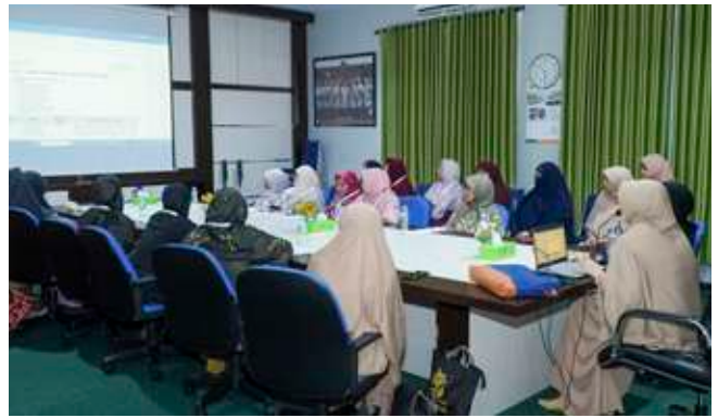
Sesi khusus ibu-ibu RnD Insantama bersama peserta PPKYC akhwat.