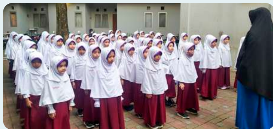
Kegiatan baris-berbaris kelas 2 SDIT Insantama Bogor.

berbaris memiliki dampak besar. Siswa dilatih untuk taat instruksi, menghargai waktu, dan bekerja sama dalam tim. Dalam barisan, semua setara, tanpa membedakan latar belakang atau kemampuan. Nilai kebersamaan, keteraturan, dan rasa tanggung jawab tumbuh dari kebiasaan ini.