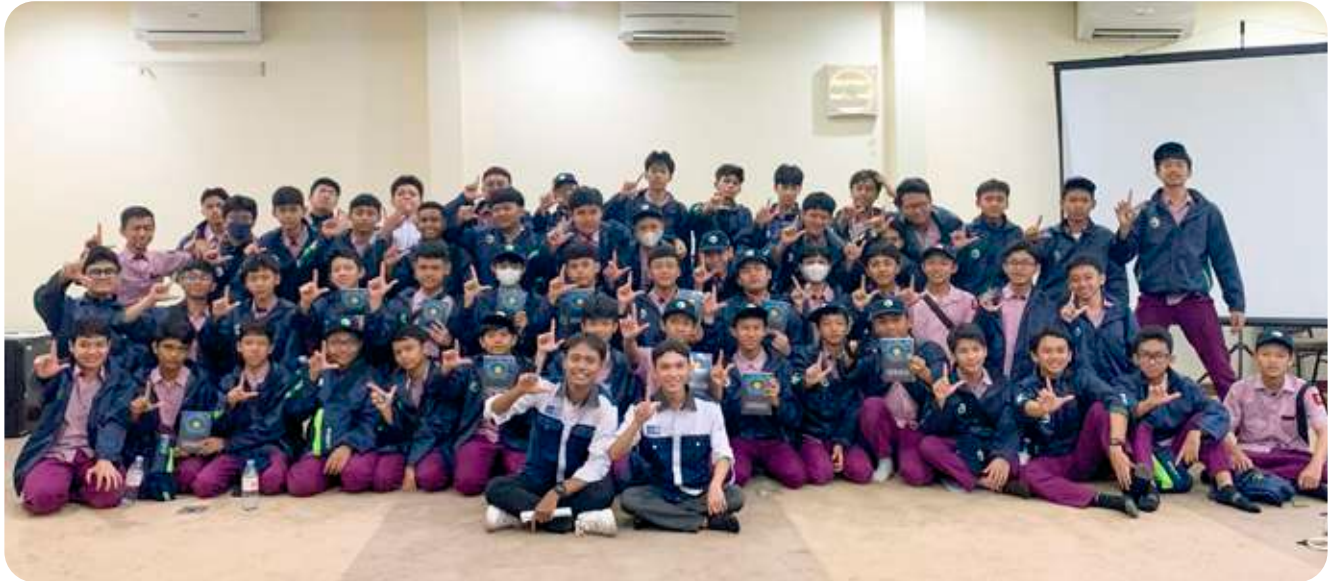
Foto bersama Gluminous ikhwan dengan tim dari IPB Press.

“Ternyata menerbitkan buku itu bukan cuma soal menulis, tapi soal keberanian berpikir dan bertanggung jawab atas gagasan, ya teman-teman.”