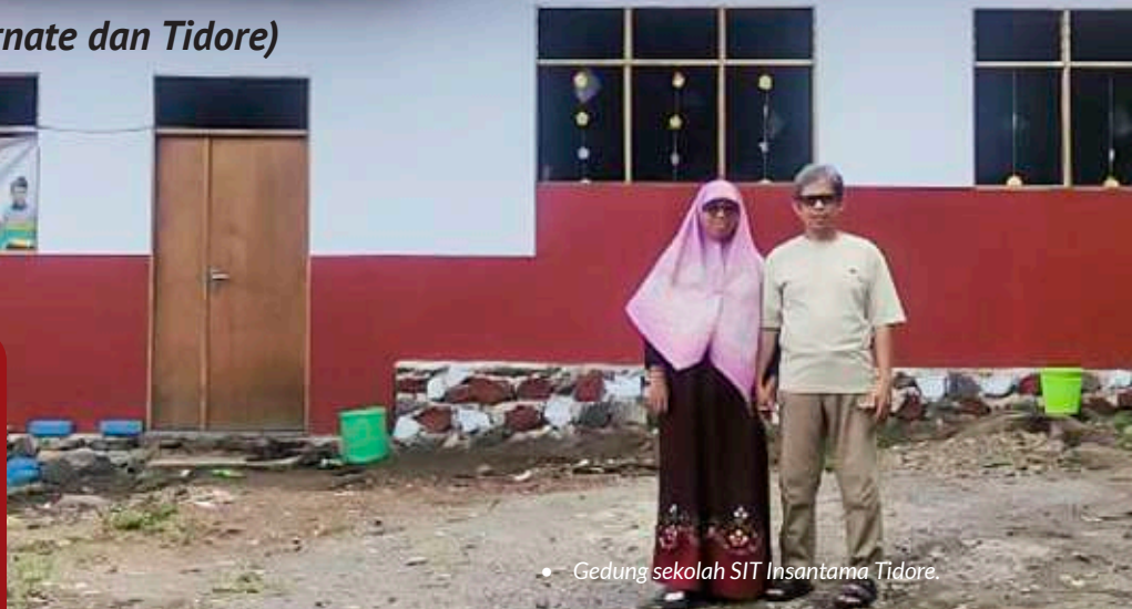
• Gedung sekolah SIT Insantama Tidore.

Menariknya, mereka juga memilih Insantama sebagai tempat belajar