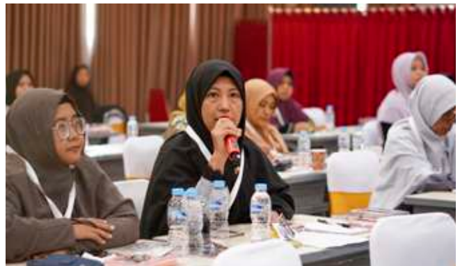
Bu Alya (Bandar Lampung) mengajukan pertanyaan kepada narasumber.