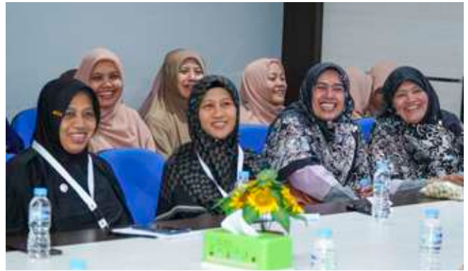
Sesi khusus ibu-ibu RnD Insantama bersama peserta PPKYC akhwat.