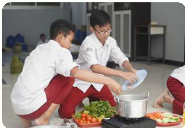
Siswa memasak secara berkelompok.

Saat adzan berkumandang, siswa dan guru bersama-sama berbuka puasa dengan penuh rasa syukur. Beragam hasil karya siswa tersaji di meja. Ditambah berbagai minuman segar hingga aneka sayuran, serta hidangan lezat lainnya. Seluruh peserta tampak lahap menikmati hidangan. Menyantap hidangan yang dimasak sendiri itu memang terasa lebih nikmat.