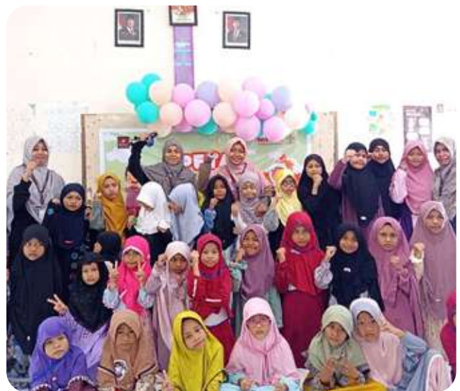
Kegiatan Pekan Ta'aruf, SIT Insantama Ternate.

Melalui permainan, ice breaking , dan sesi perkenalan, para siswa belajar tentang makna QS al-Hujurat ayat 13 bahwa saling mengenal adalah pintu ukhuwah. Meski berasal dari latar belakang yang berbeda, mereka datang dengan tujuan yang sama—belajar, berproses, dan kelak menjadi pribadi pembawa cahaya Islam. SaTu Insantama di Leuwiliang tak sekadar orientasi, tetapi