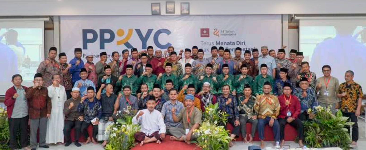
Foto bersama Yayasan Insan Cendekia dengan Yayasan Insantama cabang.

Program Pengembangan Kepemimpinan Yayasan Cabang (PPKYC)