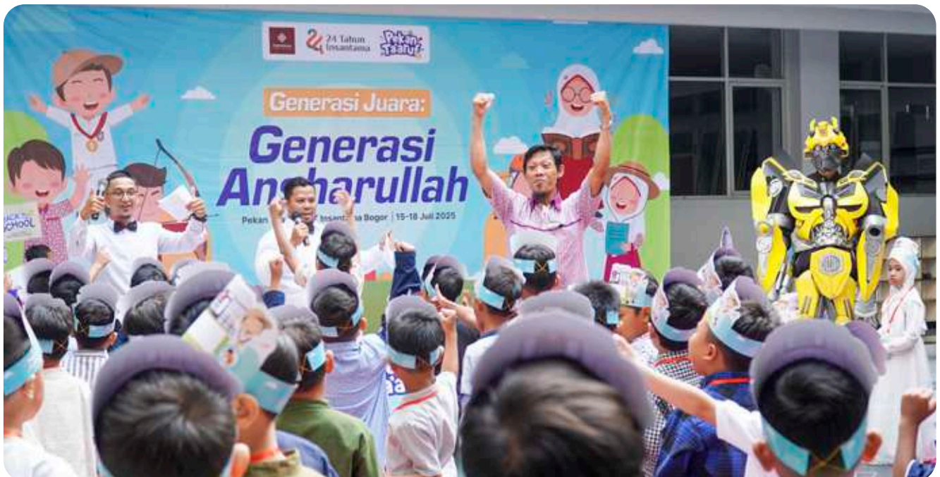
Suasana meriah Pekan Ta'aruf hari pertama (15/7/2025).