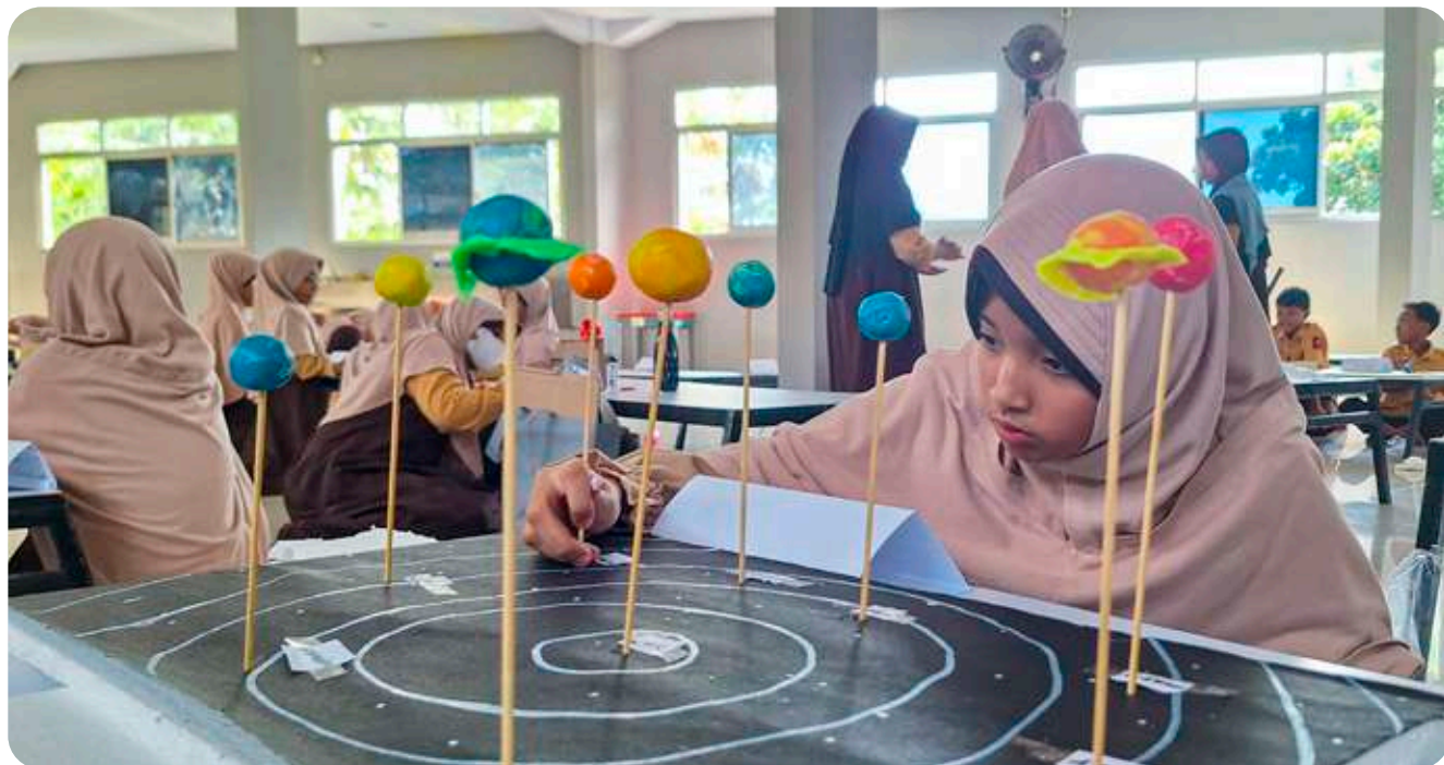
Kegiatan pembelajaran di SIT Insantama harus sejalan dengan kekhasan Insantama dan Prosedur Operasional Standar (POS) yang sudah disusun.

Penjaminan mutu di SIT Insantama bukan sekadar prosedur administratif, melainkan bagian dari misi dakwah untuk mencetak generasi shalih, muslih, dan mujahid.