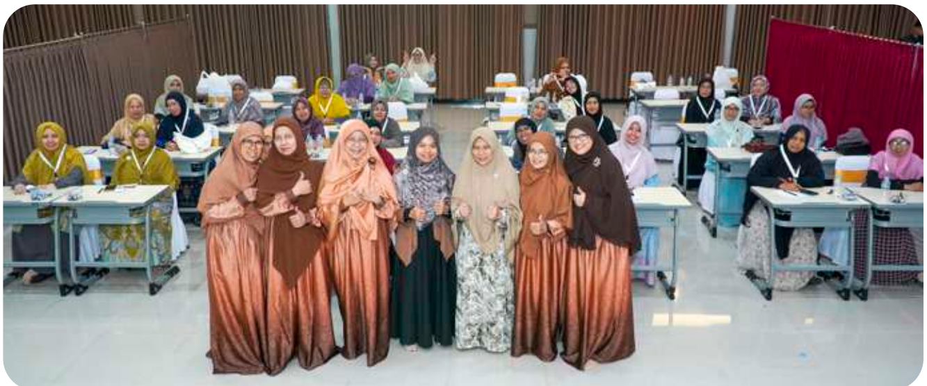
Ibu-ibu RnD SIT Insantama Bogor bersama peserta PPKYC (Insantama cabang).

Hal ini terkonfirmasi oleh Imam pasca pelaksanaan program, beberapa pengurus YIC berkunjung ke cabang dan dirasakan ada pengaruh dari PPKYC. Atau, saat Imam menelpon beberapa pengurus cabang untuk kepentingan