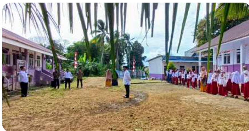
Kegiatan upacara di gedung sekolah SIT Insantama Ternate.

Kendala SDM juga lebih menantang dibanding Ternate. Guru berkualitas