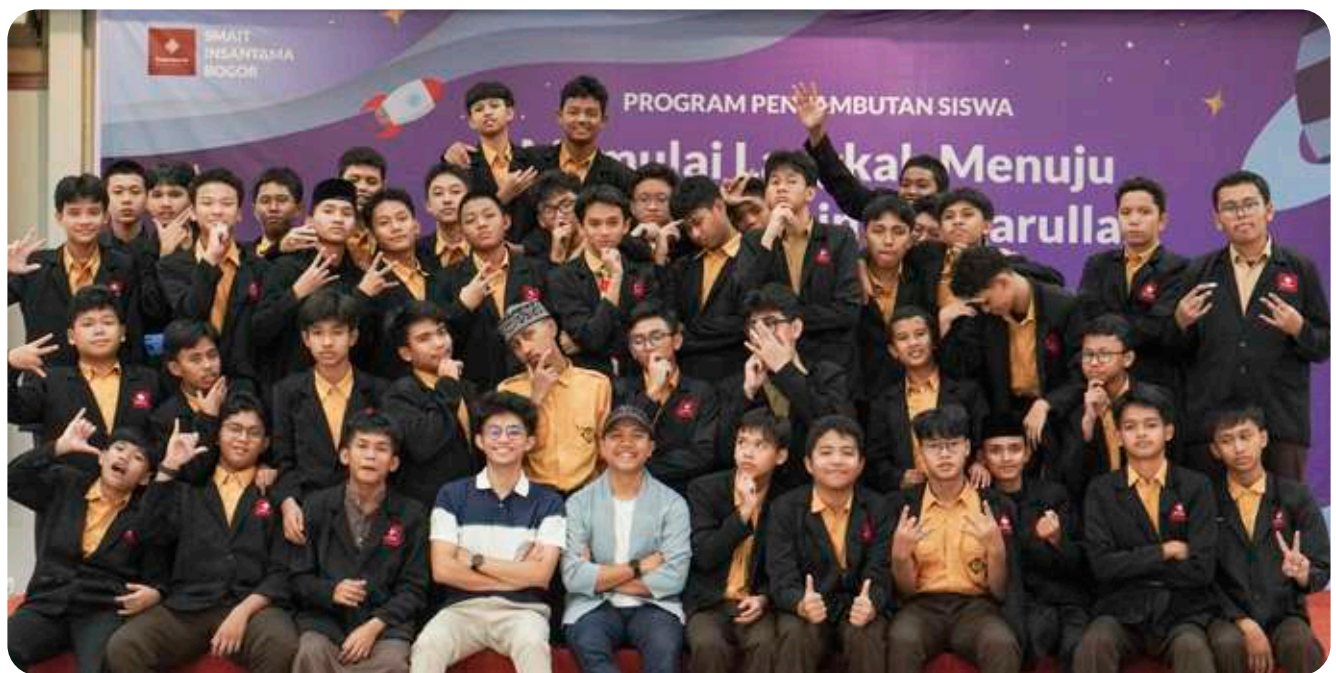
Foto bersama peserta Pelatihan Presentasi 2025 dengan pematari (alumni SMAIT Insantama Bogor).

Dan seperti pepatah dalam pelatihan ini, “Tiga menit berpikir untuk satu menit bersinar” – karena keberanian berbicara lahir dari persiapan dan latihan yang sungguh-sungguh. [] A. Rahmi