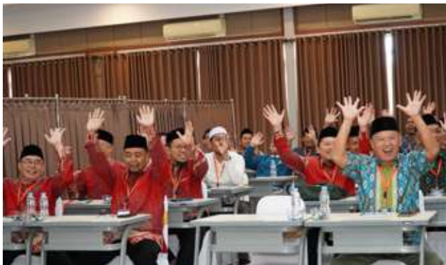
Antusiasme peserta yang terus digelorakan oleh Master of Ceremony.