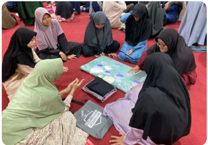
Santri praktik langsung melipat pakaian dan selimut.