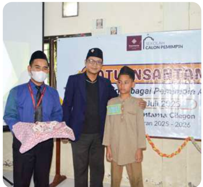
Kegiatan Satu Insantama, SMPIT Insantama Cilegon.

Tawa renyah, semangat yang menyala, dan wajah-wajah baru penuh harap menghiasi awal tahun ajaran di tiga titik nusantara. Dari Leuwiliang, Cilegon, hingga Ternate, kegiatan Masa Ta'aruf SIT Insantama —atau dikenal dengan sebutan SaTu Insantama —digelar serentak pada Juli 2025. Meski berbeda tempat, satu semangat mengikat mereka: menyambut para pelajar baru dengan kehangatan ukhuwah dan cita besar sebagai calon Ansharullah —penolong agama Allah.